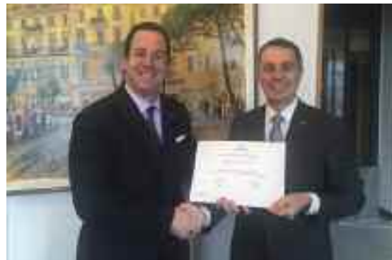
L'On. Ignazio Cassis riceve il premio

"Sono onorato di questo riconoscimento", ha detto l'Onorevole Cassis, già premiato nel 2014, aggiungendo poi: "Lo leggo come una prova del fatto che la mia azione politica è coerente nel tempo e sensibile allo sviluppo del turismo in Ticino". Turismo che per Cassis rappresenta molto per il Cantone, e che bisogna quindi valorizzare al meglio. "È vero", spiega Cassis, "di solo turismo il Ticino non vive, ma senza di esso saremmo più poveri, e non solo finanziariamente. Il turismo ci porta persone con lingue e idee diverse, spesso molto innamorate del nostro Cantone. Queste persone arricchiscono anche culturalmente la nostra società". L'infrastruttura riveste chiaramente un ruolo fondamentale per il settore turistico. In questo senso, la combinazione Ticino Ticket - Galleria di base del San Gottardo potrebbe contribuire al rilancio del settore. "La rete ferroviaria, come quella stradale, sono decisive. L'allacciamento ferroviario agli aeroporti internazionali di Zurigo e Malpensa è una priorità: con AlpTransit siamo più vicini a Zurigo di mezz'ora, con la Mendrisio-Malpensa dal 2018 avremo finalmente un rapido accesso a quest'aeroporto". Non è solo però questo, l'aspetto su cui Cassis crede la politica si debba chinare per favorire il turismo. "Altro aspetto è il commercio: vacanze vuol dire spesso shopping. Una maggior flessibilità per l'apertura dei negozi a vocazione turistica è di centrale importanza. Con la mozione Abate abbiamo migliorato questo aspetto".