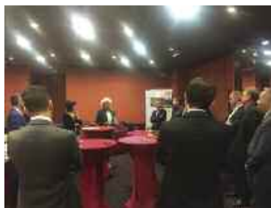
Il Business Aperò con l'On. Roberta Pantani

Il 6 ottobre, nella cornice dell'Hotel Villa Orselina Resort & Suite Hotel di Orselina, ha partecipato all'incontro Christian Vitta . Nato nel 1972, è stato sindaco di S. Antonino dal 2000 al 2015 e membro del Gran Consiglio dal 2001 al 2015. Nell'aprile del 2015 è stato eletto in Consiglio di Stato, assumendo la direzione del Dipartimento delle finanze e dell'economia (DFE). Si impegna per promuovere il rinnovo delle strutture turistico-alberghiere, per il Ticino Ticket e per far conoscere il nostro territorio e le sue strutture turistiche al di fuori dei confini nazionali.