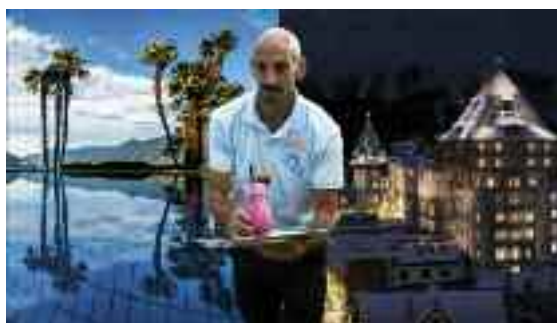
Un collaboratore stagionale che partecipa al progetto Mitarbeiter-Sharing